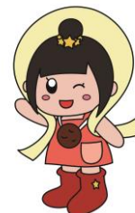
本校キャラクター きらきらちゃん