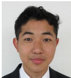
ねん ふくかいちょう 2年・副会長