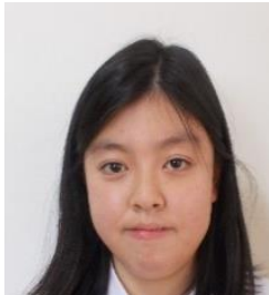
ねん せいとかいちょう 3年・生徒会長