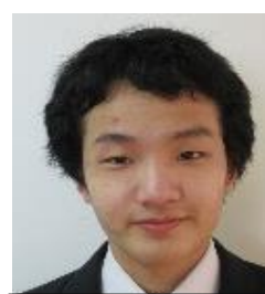
ねん しよき 2年・書記