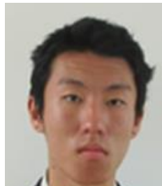
ねんふくかいちょう 3年副会長